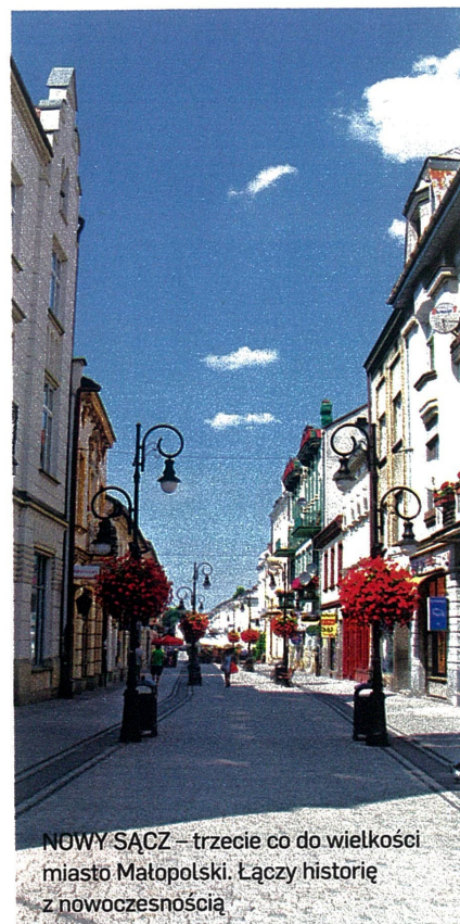
NOWY SĄCZ – trzecie co do wielkości miasto Małopolski. Łączy historię z nowoczesnością