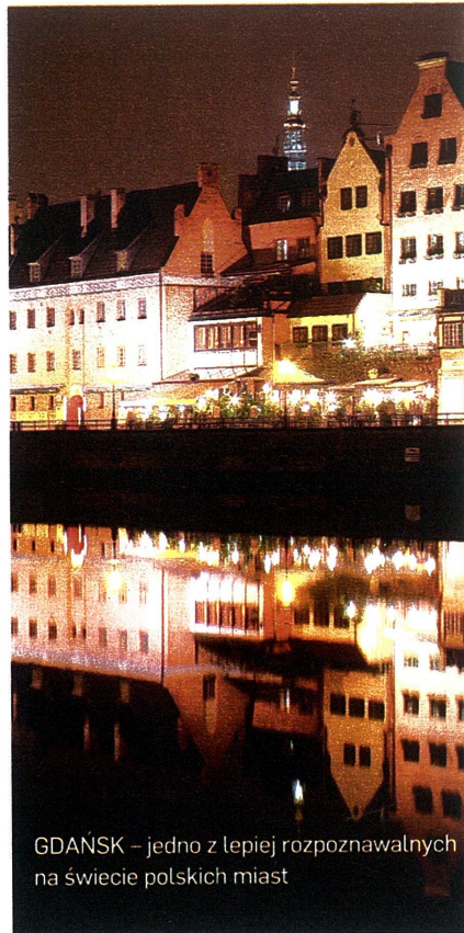
GDĄŃSK – jedno z lepiej rozpoznawalnych na świecie polskich miast

Już po raz ósmy Związek Powiatów Polskich ogłosił listę najlepszych powiatów i gmin. W 2010 roku na czele znalazły się: Gdańsk i Nowy Sącz (ex aequo), Polanica-Zdrój, Kobylnica oraz powiat kielecki. Laureaci otrzymali honorowe tytuły Dobrego Polskiego Samorządu. Powiat kielecki czołowe miejsca w rankingu ZPP zajmuje już od czterech lat. Podobne sukcesy notuje mała Kobylnica, licząca zaledwie 4,5 tys. mieszkańców. Gmina położona w województwie pomorskim po raz trzeci z rzędu